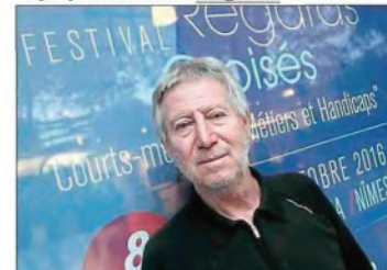
Le réalisateur participe pour la première fois à ce festival.